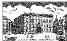
Senato della Repubblica

Il Premio ha richiesto gli ambiti Patrocinati: